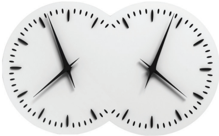
Anges Inseparables © Esther Shalev Gerz

***22:00 | SCIENCES DE LA VIE | Joy Sorman | Mix | Hall du Palais des études | 5h***